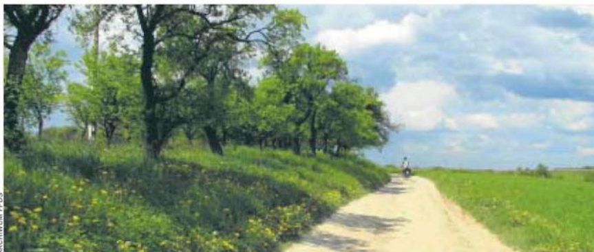
Zielony Szlak „Greenway” Kraków-Morawy-Wiedeń

rych kusi zdrowa rywalizacja - dodaje Małgorzata Fedas. - A kolekcjonery pieczętek w paszportach będą wniebowzięci!